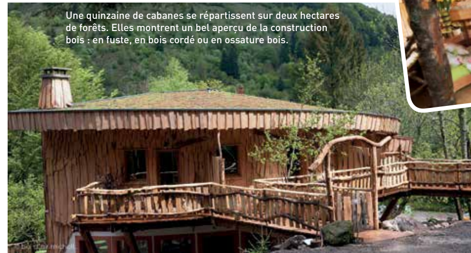
Une quinzaine de cabanes se répartissent sur deux hectares de forêts. Elles montrent un bel aperçu de la construction bois : en fuste, en bois cordé ou en ossature bois.

Parce que les cabanes sont au cœur de la nature, elles ont entièrement été éco-conçues ! Des toilettes sèches ont été installées dans la cabane. Un poêle permet de réchauffer les nuits les plus fraîches. La cabane a été isolée avec de la fibre de bois.