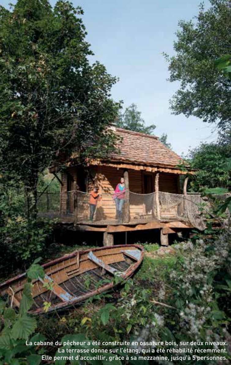
La cabane du pêcheur a été construite en ossature bois, sur deux niveaux. La terrasse donne sur l'étang, qui a été réhabilité récemment. Elle permet d'accueillir, grâce à sa mezzanine, jusqu'à 5 personnes.