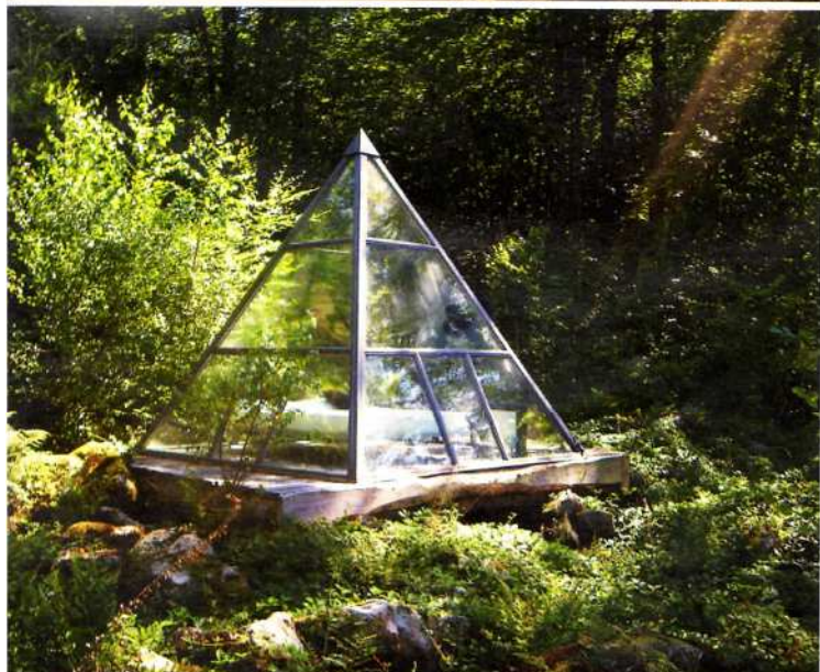
La pyramide de verre de la Ferme Aventure.

la-ferme-aventure.fr , bol-d-air.fr , nidsdesvosges.com