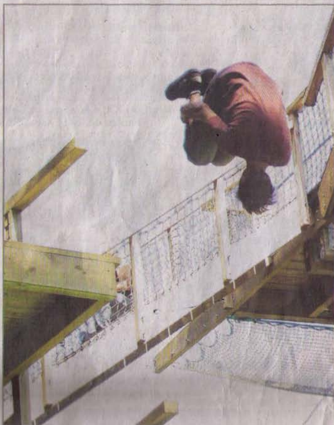
Toutes les figures sont possibles avec le big air jump. A découvrir dès jeudi ! (Photos : Eric Thiébaud)